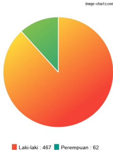
Gambar 1. Profil Kelompok Jenis Kelamin Responden